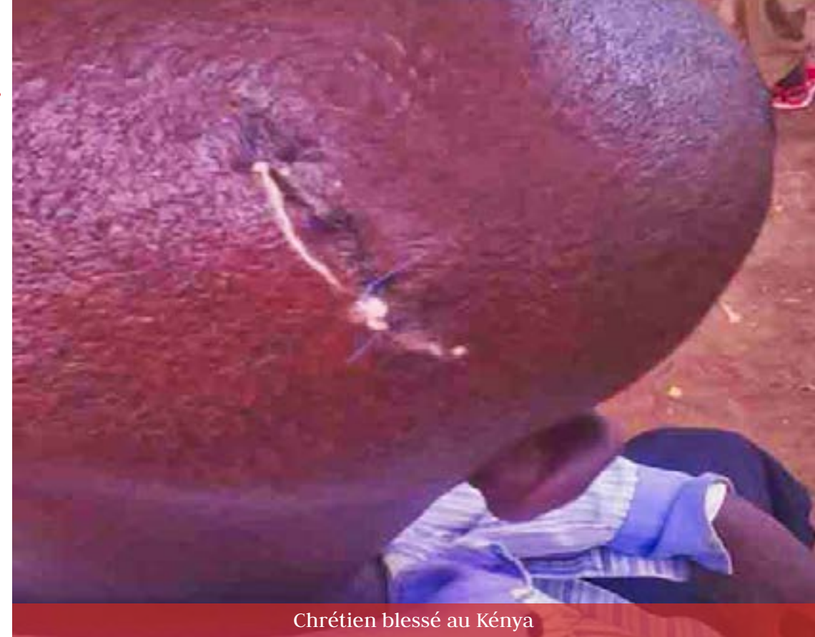
Chrétien blessé au Kenya

Ces derniers, dans leur fuite, ont également tiré sur les personnes qu'ils rencontraient. La fusillade a coûté la vie à 17 personnes – dont sans doute 14 fidèles – et 12 autres ont été blessées et transportées dans un hôpital voisin. Aucune "revendication" pour cet attentat aussi lâche que meurtrier.