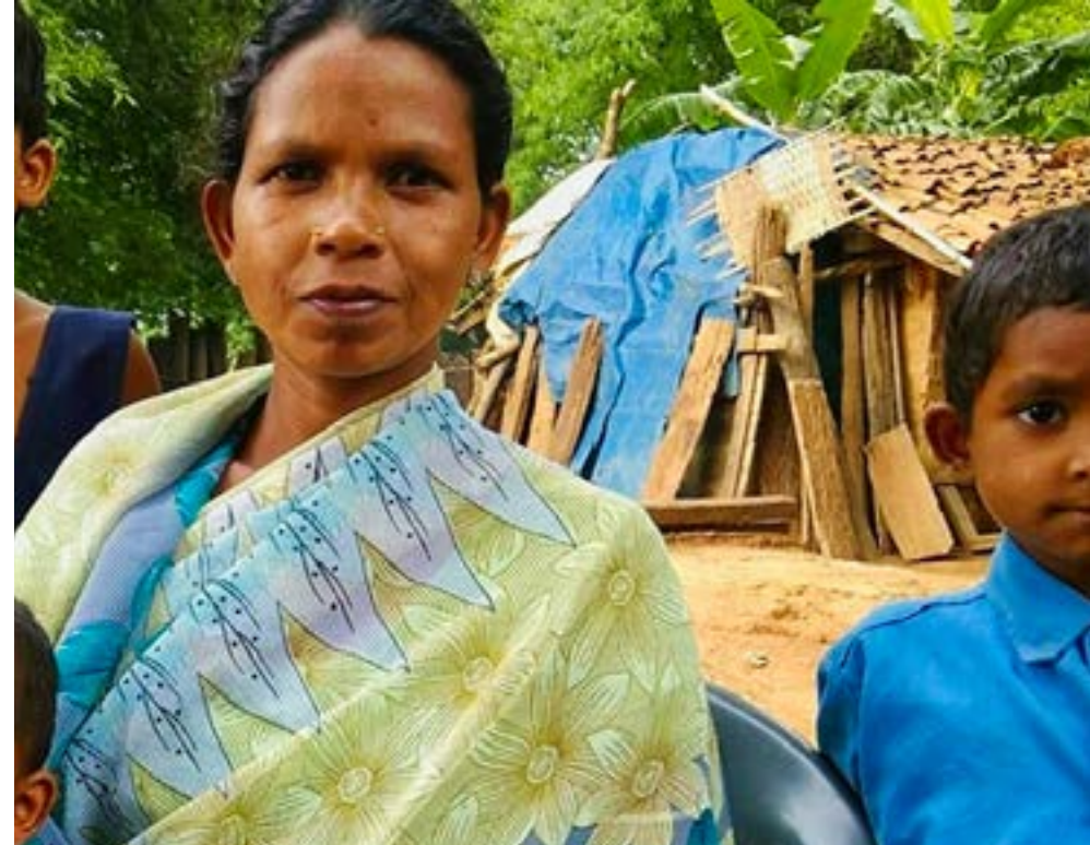
Inde - Chrétienne chassée de son village