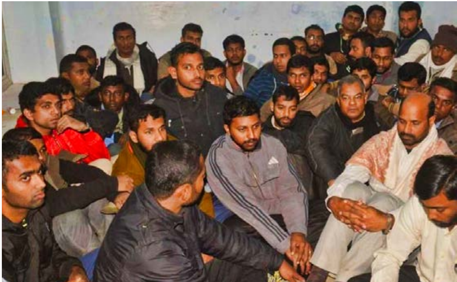
30 chrétiens arrêtés en Inde

Merci de prier pour les chrétiens vivant en Inde en cette fin d'année.