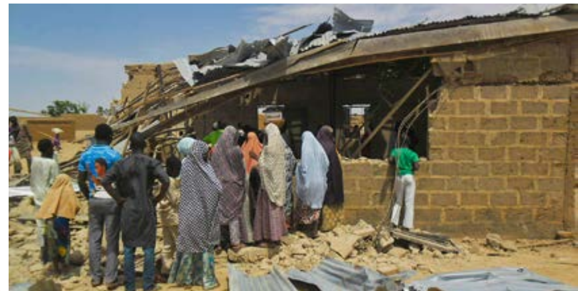
Église détruite au Nigéria