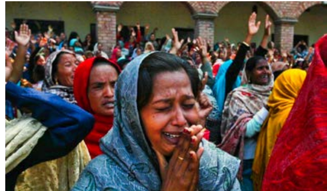
Chrétiens au Pakistan